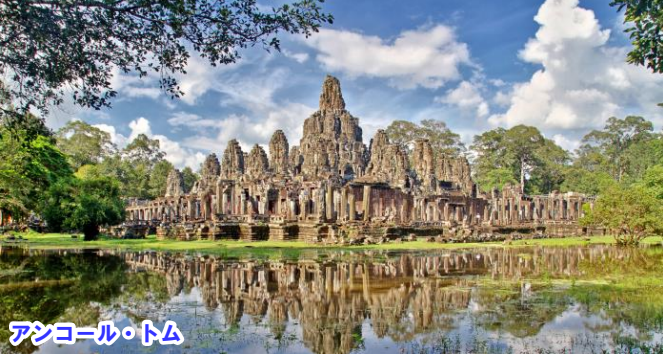
アンコール・トム